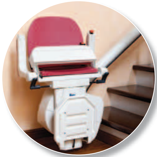
Encombrement minimum avec repose-pieds rabattable