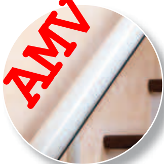
Ivoire (de série)