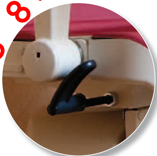
Levier de déblocage pour faciliter la descente à l'étage d'arrivée